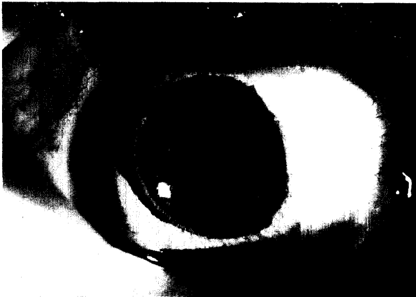
Fig. 2. Eye of patient 1, 3 months after surgery.

52세 여자환자가 1994년 5월 3일 내원 1-2년전부터 서서히 시작되는 시력감퇴가 있었으나 불편없이 지내다가 내원 15일전부터 안통과 두통을 주소로 개인병원 방문후 본원으로 전원되었다. 환자는 과거력