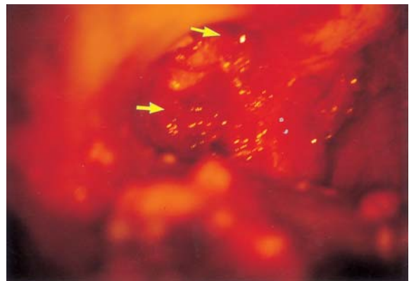
Fig. 3. Intraoperative finding in case 2 shows a friable, well-encapsulated tumor mass (2 x 3 cm), occupying the right middle ear cavity and mastoid air cells with its adhesion to the dura mater (arrows).

골로 파급된 소견을 보였다. 수술창의 재건술을 위하여 유양동 폐쇄 및 중간층 피부 이식편을 이용하였다(Fig. 3&4). 수술 후 2개월이 지나 약 1개월간 방사선치료(5,400 cGy, Co 60 )를 시행하였으며, 5년이 경과한 현재까지 재발의 소견없이 건강한 모습을 보이고 있다.