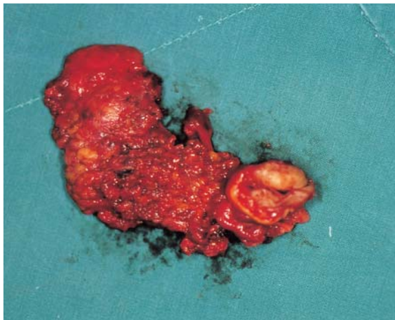
Fig. 2. Excised tumor mass in case 1.