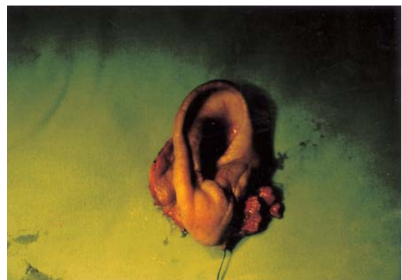
Fig. 4. Excised tumor mass including the right auricle in case 2.