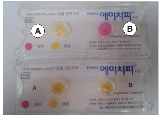
Fig. 1. Examples of positive and negative results with CLO test. Yellow color (A) is recorded as negative and orange or pink color (B) is recorded as positive.

통계학적 분석은 window용 SPSS version 19.0(SPSS Inc. Chicago, IL, U.S.A.) 프로그램을 이용하여 Pearson's