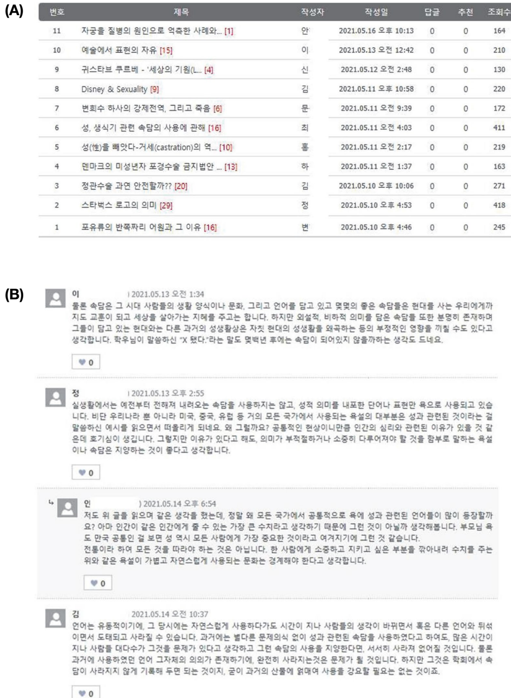
Fig. 1. Examples of topics and content of online discussion. (A) List of subtopics for discussion; (B) Examples of opinions presented in online discussions.